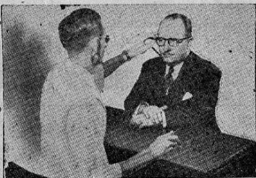
PREPARACION DE RECETAS DE OCULISTAS

Todos los candidatos deben estar en condiciones de pagar por lo me-